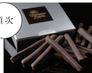
オレンジピールショコラ