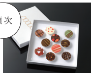
バレットショコラ