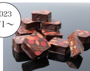
ショコラブラウニー ノワール