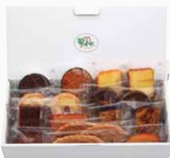
ドゥミセックC [焼き菓子17点]