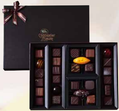
ショコラ [28個入] ¥6,680+税