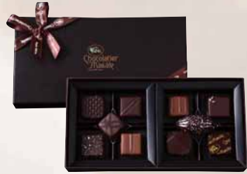
ショコラ [10個入] ¥2,580+税