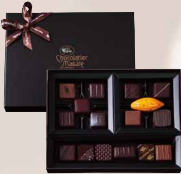
ショコラ [16個入] ¥3,940+税