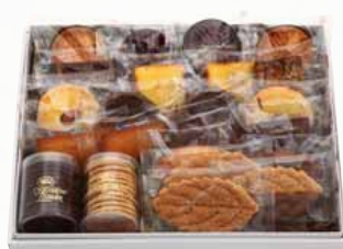
ドゥミセックD [焼き菓子23点]