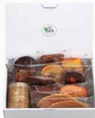
ドゥミセックB [焼き菓子12点]