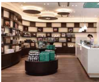
新千歳空港出発ロビー店