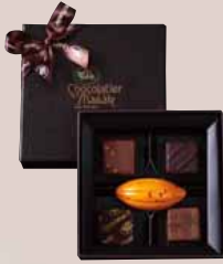
ショコラ [5個入] ¥1,440+税